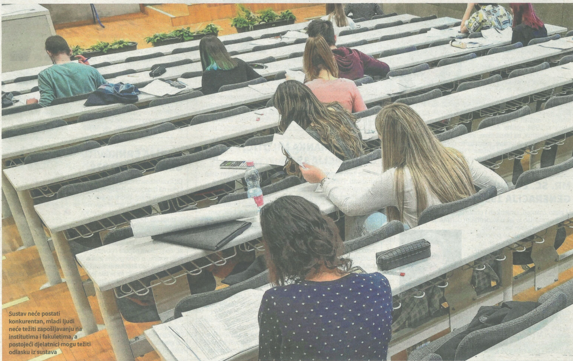
Sustav neće postati konkurentan, mladi ljudi neće težiti zapošljavanju na institutima i fakultetima, a postojeći djelatnici mogu težiti odlasku iz sustava

3 Ne, plaće u našem sustavu nisu primjerene, niti tržištu rada, a niti misiji i temeljnoj funkciji koju znanost i visoko obrazovanje treba imati u nekom društvu. A kada se pogledaju neka usporedna radna mjesta u drugim sektorima javnih službi, npr. u kulturi ili zdravstvu, onda ta konstatacija dodatno dobija na težini. Naime, kako objasniti nekome da arhivski savjetnik u sektoru kulture ima gotovo isti koeficijent kao i docent? Ovaj prvi ne mora ni doktorirati niti podliježe izboru/reizboru odnosno javnoj verifikaciji svoga rada. Ili kako nekome objasniti da primarius u bolnici ima veći koeficijent od redovitog profesora, kada se zna da ovaj prvi ima u odnosu na prof. vrlo malo stručnih uvjeta za to radno mjesto, te da tu poziciju može dostići već sa 10 god. staža, dok red. prof. ima daleko teže uvjete, a koje ispunjava tek nakon 20-tak godina staža? A situacija po kojoj sudac početnik ima veću plaću od redovitog profesora, odnosno znanstvenog savjetnika mislim da jasno pokazuje kako se vrednuje znanost u »zemlji znanja«.