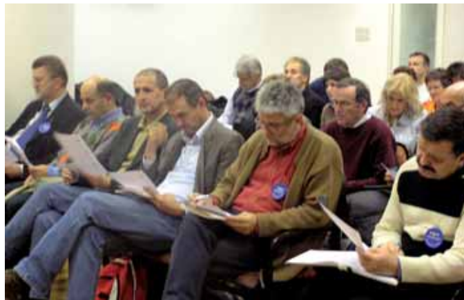
LZ "M. Krleža" – Skup Vertikale – priprema Štrajka 2006.