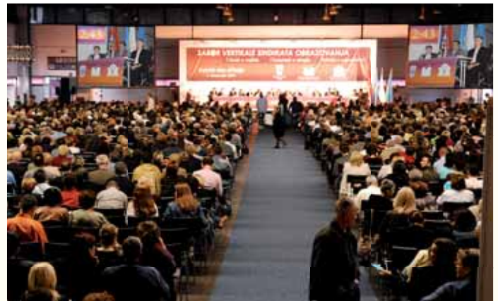
Sabor Vertikale – 5. listopada 2007.

Najvrednije postignuće su sporazumi o plaćama kao rezultat naših štrajkova. Neće biti vlade koja ih neće pokušati dovesti u pitanje. Trebat će ih braniti za stolom, ali možda i na sudu ili opet štrajkom. Zato trebate izabrati ljude koje poštujete, kojima vjerujete i čiju ćete aktivnost slijediti, ljude koji će vas iscrpno informirati i suvislo obrazložiti zašto je svaka inicijativa Sindikata u vašem interesu.