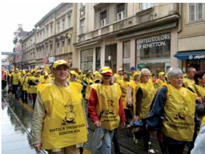
Prosvjed 12. travnja 2008.

Sindikati u nekim zapadnim zemljama uspjeli su u zavidnoj mjeri, ali u nekim zemljama i nisu, u nekima su veoma slabi i na margini utjecaja. To je ovisilo najviše o svijesti samih članova. Vaš će Sindikat biti onakav kakve ljude izaberete. Zato je odgovornost na vama, vama i samo vama.