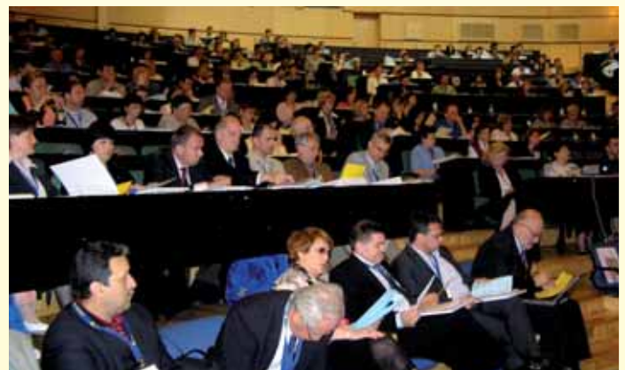
6. Sabor Sindikata – 6. svibnja 2006.

“Smatram važnim, upravo neophodnim, udruživanje intelektualnih radnika, kako zbog zaštite vlastitog ekonomskog statusa, tako i - općenito govoreći - radi utvrđivanja utjecaja u području politike.”