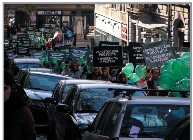
Prosvjed studeni 2004. godine, zbog sveopćeg odnosa prema znanosti i prosvjeti, zbog izostanka pregovora...

Budemo li izbjegavali aktivnosti za opće dobro otvaramo prostor za ulazak u javni i politički život ljudima sumnjivih i prozaičnih motiva.