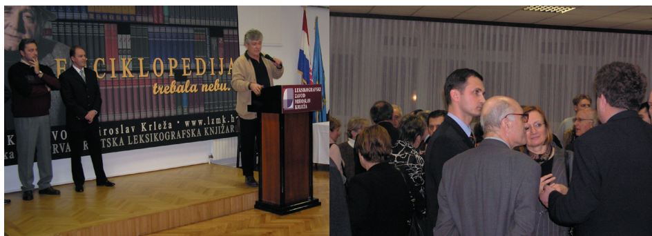
Akademik Radman na obilježavanju 15 godina Sindikata

Studen 2004. godine: prosvjed dvije tisuće ljudi. Prema riječima novinara, bio je to najbolji i najzanimljiviji prosvjed dosad održan. Jedina manjkavost: nije nas bilo dovoljno. A trebalo je. Ponekad bez pritiska stvari nije moguće pomaknuti na bolje. Pritisak mora biti uvjerljiv.